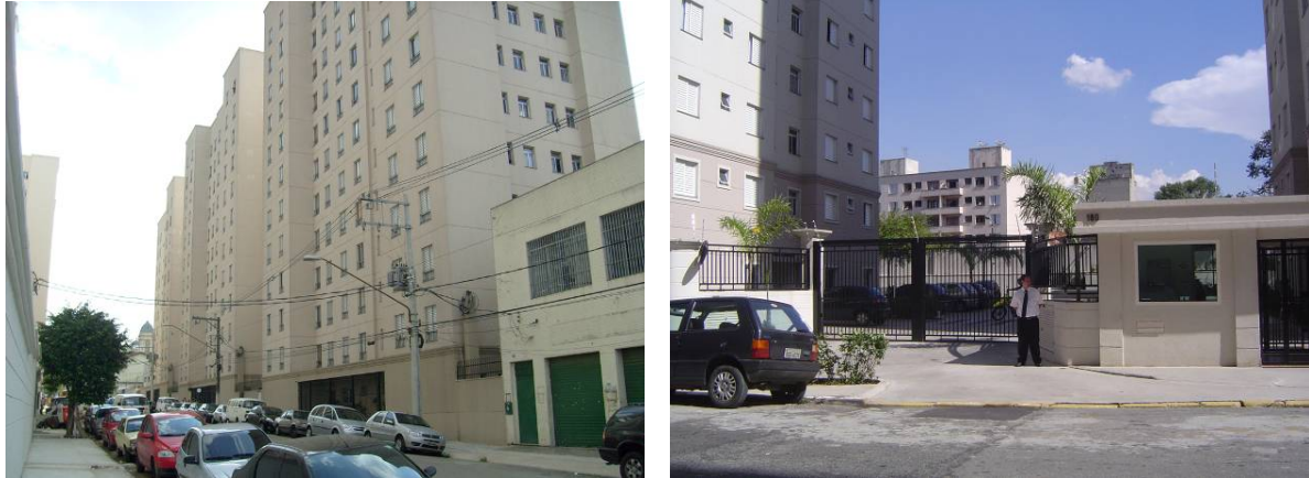
Imagem 4 e 5 - Vista do empreendimento de HIS e de HMP (ZEIS 3 – Rua 25 de Janeiro).