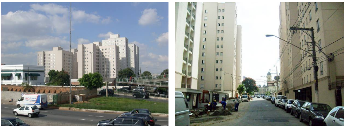
Imagem 2 e 3 – Vista do empreendimento em ZEIS 3 no centro de São Paulo (Rua 25 de Janeiro).

A forma resultante do projeto da Rua 25 de Janeiro, indica que há uma distância significativa entre a viabilização de empreendimentos dessa natureza e a concepção de projetos adequados a condição urbana pré-existente na área central. Os edifícios de HIS e HMP configuram-se como empreendimentos distintos, separados em diferentes lotes, apresentando distinções significativas na forma de apropriação do espaço. A adoção da forma condomínio isolado em ambos os casos pouco dialoga com o tipo de parcelamento e edifícios típicos da área central de São Paulo. São resultado de um padrão estabelecido e adotado pelo mercado imobiliário no restante da cidade como já mostrado anteriormente.