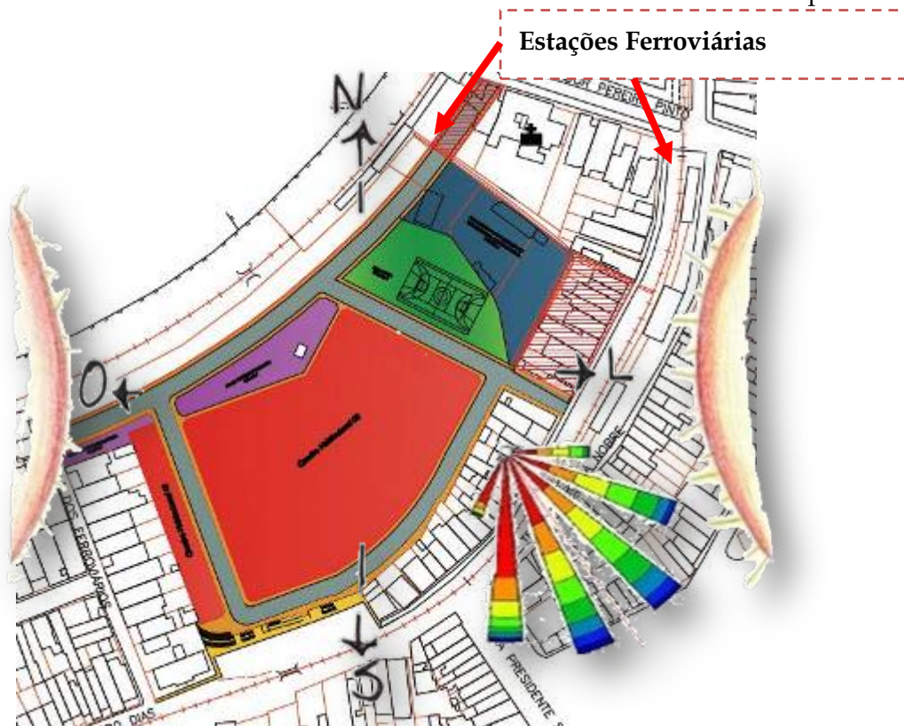
Figura 2: Zoneamento da proposta técnica.

Ao final da segunda fase do Plano de Estruturação, obteve-se a proposta técnica do parcelamento final com o zoneamento conforme discutido até o momento e apresentado na Figura 2.