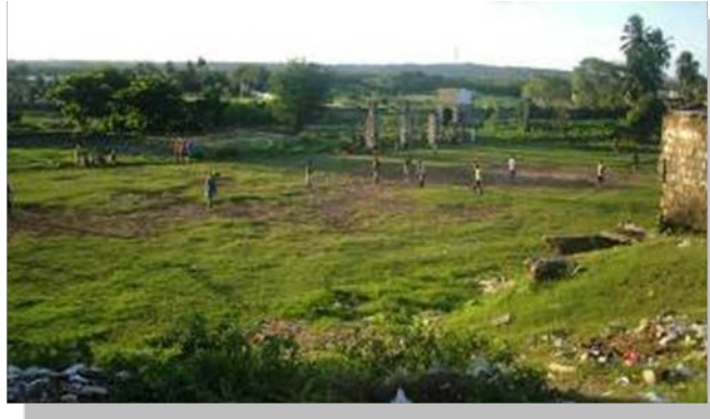
Figura 1: Vista geral da área livre, a qual teve seu parcelamento discutido com a comunidade Guarita.

Na oportunidade da elaboração desse parcelamento, as discussões foram estruturadas em três fases principais: FASE 1: Compreensão da realidade, através da formulação de um Diagnóstico Urbanístico síntese definido pela discussão da Leitura Técnica desse Diagnóstico e a Análise Comunitária do mesmo realizada no 1º encontro. A partir desse Diagnóstico síntese também se formularam os Eixos de Intervenção e o Programa de Necessidades; FASE 2: Dimensionamento habitacional com base em critérios técnicos aferidos pela comunidade na 2º Reunião; FASE 3: Proposição do Plano de Estruturação Urbana para a área livre da Guarita, resultante da síntese entre as propostas técnicas e os apontamentos da comunidade discutidas na 3º Reunião, conforme ilustrado no metodológico síntese (Quadro 01).