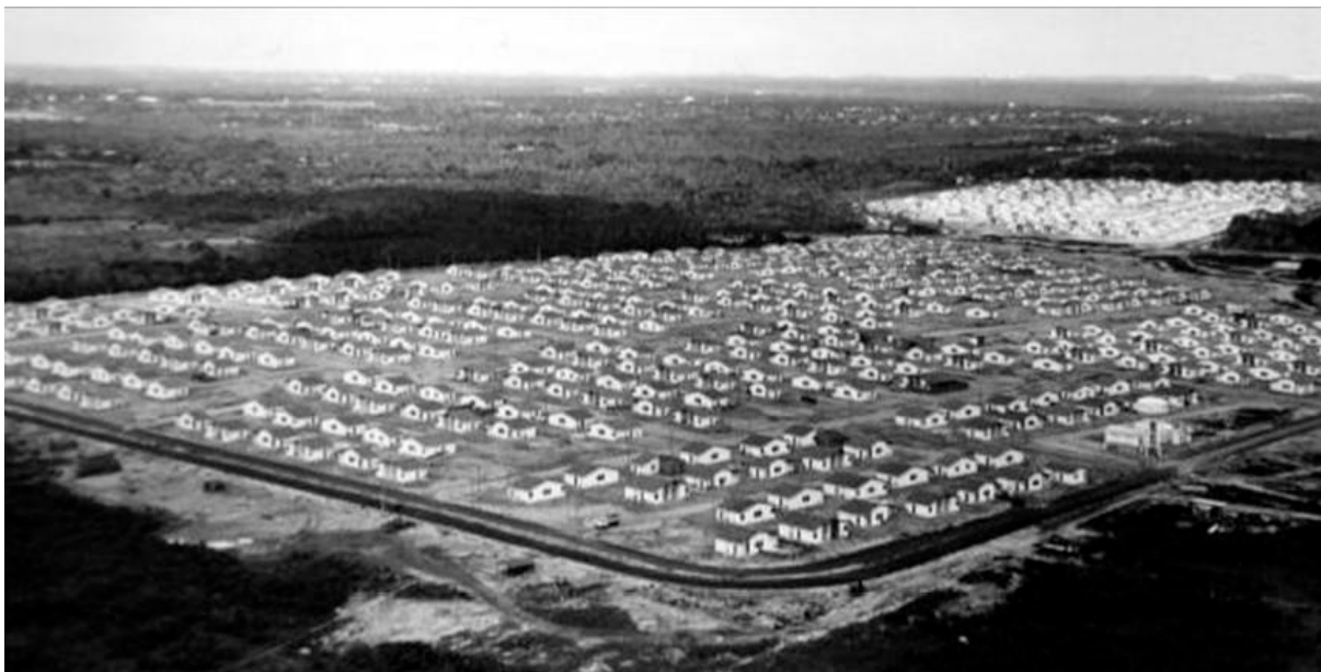
Figura 4 | Imagem aérea do Conjunto Industrial, construído pela COHAB na RMF