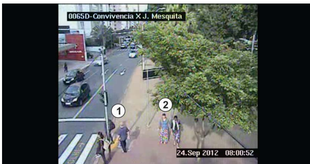
Figura 4: Fruição da praça e fluência sobre praça