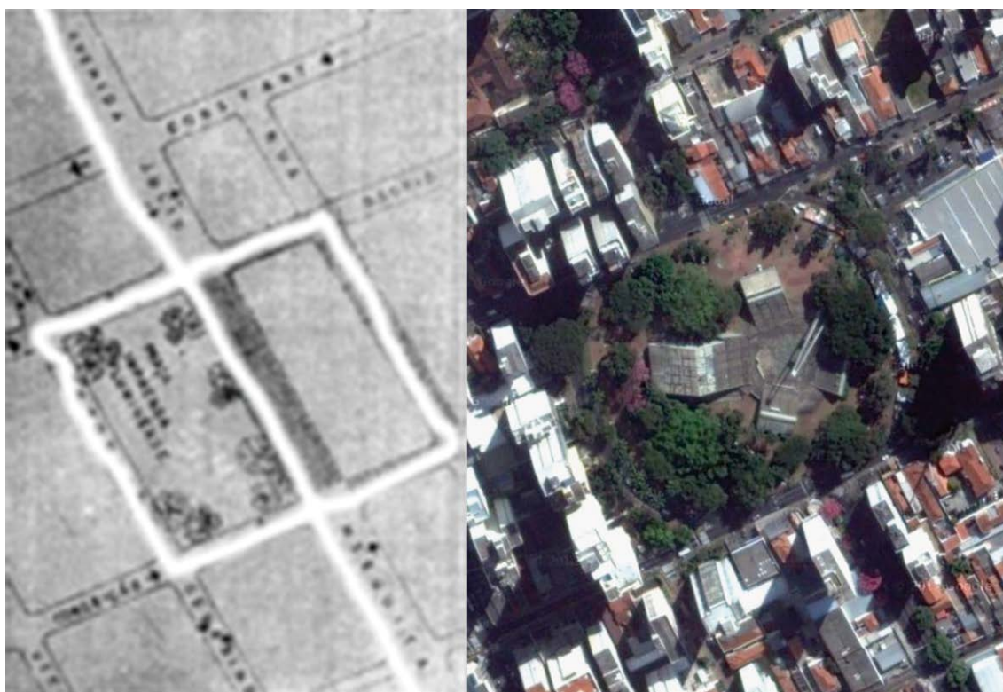
Figura 1: Quadras utilizadas para implantação e o CCC hoje.

Para este espaço, então, foi projetado o Centro de Convivência Cultural, pelo arquiteto Fábio Penteadó em 1967, a partir de outros dois projetos do arquiteto que concorreram em concursos nos dois anos anteriores, um na própria cidade de Campinas ("Teatro de Ópera") e outro na cidade de Goiânia ("Monumento à Fundação de Goiânia"). A junção dos dois projetos, com o aumento da escala da praça multiuso no projeto goiano e as finalidades do projeto campineiro redundou no projeto do Centro de Convivência.