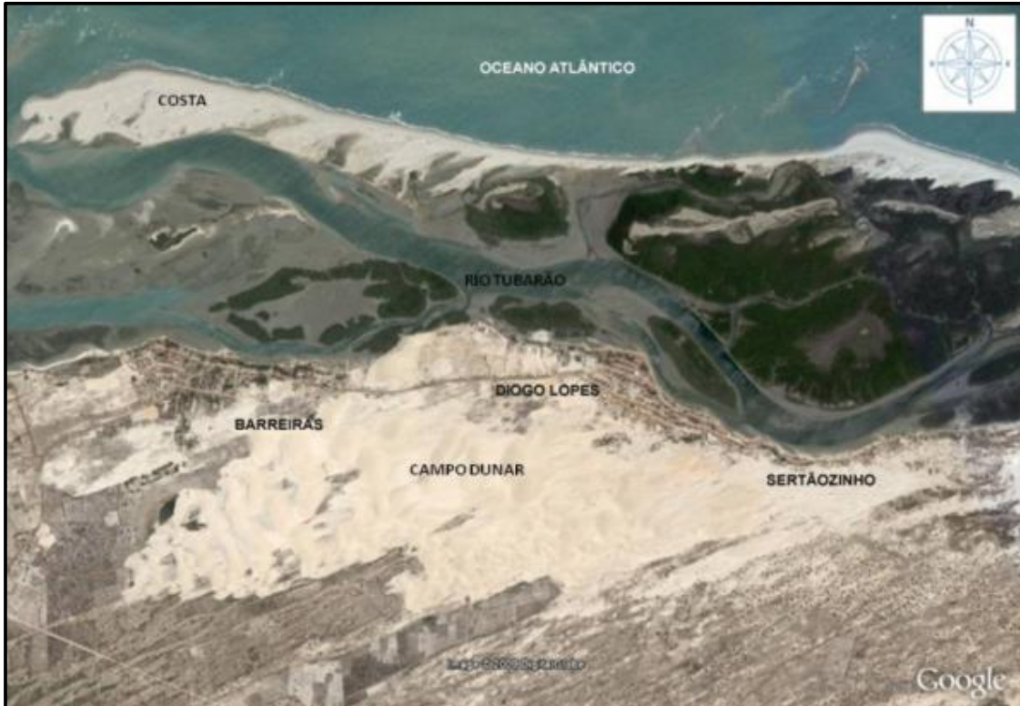
Figura 1 – Situação de ocupação das comunidades

O Conselho das Cidades através da Resolução nº 34/2005 recomenda que o Plano Diretor deva: “demarcar os territórios ocupados pelas comunidades tradicionais, tais como as indígenas, quilombolas, ribeirinhas e extrativistas, de modo a garantir a proteção de seus direitos”, com referência à instituição das Zonas Especiais.