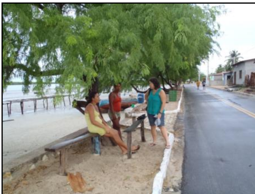
Figura 4 - Via principal asfaltada em 2010

recentemente a implantação de uma Usina Eólica na Reserva. Além dos impactos ambientais causados por essa atividade provenientes de movimentos de terra, construção de estradas de acesso, incremento da população local pela população flutuante (necessária para a implantação do empreendimento) e impactos visuais, também se altera a noção de território onde essa população tradicional se reproduz econômica e socialmente.