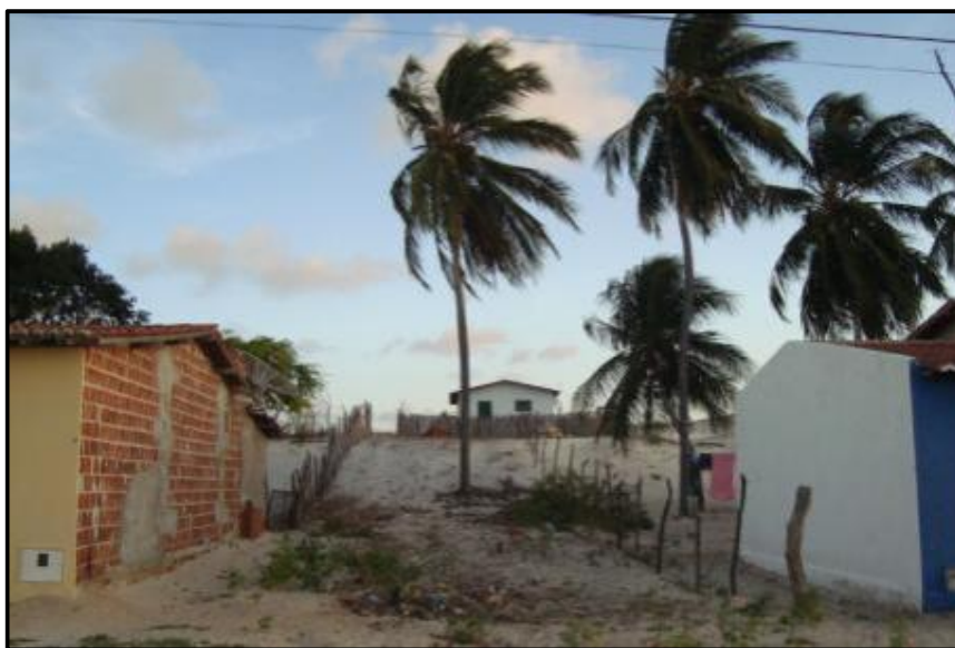
Figura 2 - Construções na Reserva