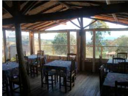
Espaço Flor das Águas em Cunha-SP