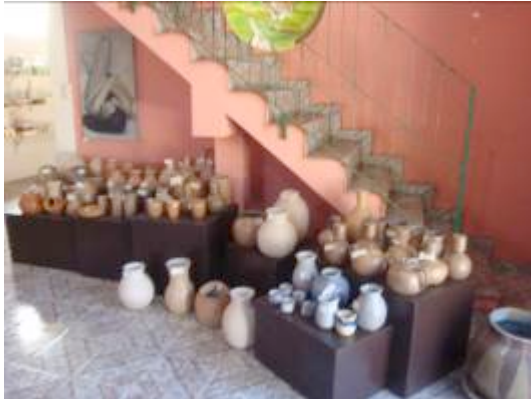
Casa do Artesão em Cunha-SP

degustação de produtos orgânicos regionais são possibilidades de ação neste sentido. Como exemplos de iniciativas já consolidadas pode-se citar a Casa do Artesão, próxima à entrada da cidade, e o Espaço Flor das Águas, propriedade rural nos limites do perímetro urbano que, além de restaurante e pousada, também é um dos principais produtores de mel da região.