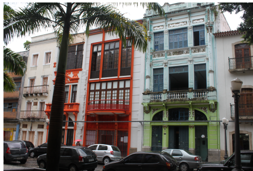
À Esquerda, Cruzeiro de São Francisco, Centro Histórico de Salvador, imóveis recuperados que marcam um dos pontos determinados como atrativo ao turismo (BRAGA, out. 2012). À direita, Rua do Bom Jesus, Recife, um dos polos de intervenção para turismo na área (BRAGA, jun. 2010).