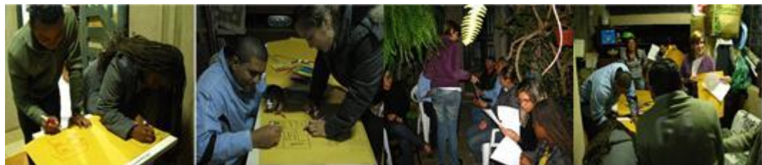
Figura 2 - Processo de projeto de Habitação Social (PMCMV-Entidades) desenvolvido junto à comunidade da Vila Telebrasília – DF, desenvolvido por Luísa Venâncio