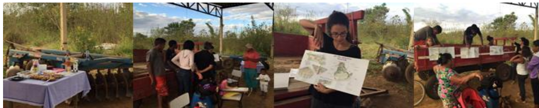
Figura 1 - Processo de projeto dos Espaços Socioprodutivos desenvolvido junto à comunidade do Assentamento Pequeno William do MST, desenvolvido por Camila Maia

A intenção do grupo Periférico é se tornar outro PEAC da UnB e estender para a pós-graduação para dar apoio também ao CASAS com estudantes da pós-graduação. Portanto, o objetivo desta comunicação é apresentar esta proposta de Extensão Universitária do grupo Periférico, demonstrar os resultados dessa experiência, com a metodologia utilizada no processo de projeção, tanto a participação quanto as análises e soluções de padrões espaciais baseados em Alexander et al (1977) e padrões dos ecossistemas urbanos desenvolvidos por Andrade (2014), propostas alternativas desenvolvidas ao longo do processo e o produto final.