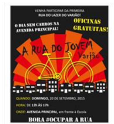
Figura 4 – Cartaz da 1ª Rua do Jovem do Varjão

Feitas as parcerias, deu-se início à busca de mais atividades, oficinas e apresentações que poderiam ser ministradas e realizadas com os jovens na rua. Vários coletivos e grupos culturais participaram do evento, oferecendo oficinas. O Rodas da Paz, por exemplo, mobilizou seu grupo para realizarem a ocupação da rua. Assim se deu a primeira rua de lazer do Varjão denominada “A Rua do Jovem do Varjão”. A divulgação ocorreu através das redes sociais, panfletagem e por um carro de som que passou três dias antes do evento e no dia anterior. A Administração ficou responsável pelo equipamento de som, pelas tendas e pela distribuição de água. Logo que o DETRAN fechou a rua no trecho proposto, os jovens foram chegando aos poucos, com suas bicicletas, skates e patins. Em poucos minutos havia muitas crianças brincando, mesmo sob o sol quente. Dentre as atividades realizadas, houve Capoeira, apresentações musicais de Rap e Gospel, Maracatu, aulas de Zumba, oficinas e o mutirão de pintura de uma faixa de pedestres colorida na Avenida Principal, em um trecho onde há intensa movimentação de estudantes. Dado o sucesso da “Rua do Jovem no Varjão”, o evento entrou para a agenda da Administração Regional. A intenção é que a cada rua do lazer ocorra duas vezes por ano. Até o momento está na 3ª edição, o muro da escola e a arquibancada da praça principal com losangulos coloridos foram