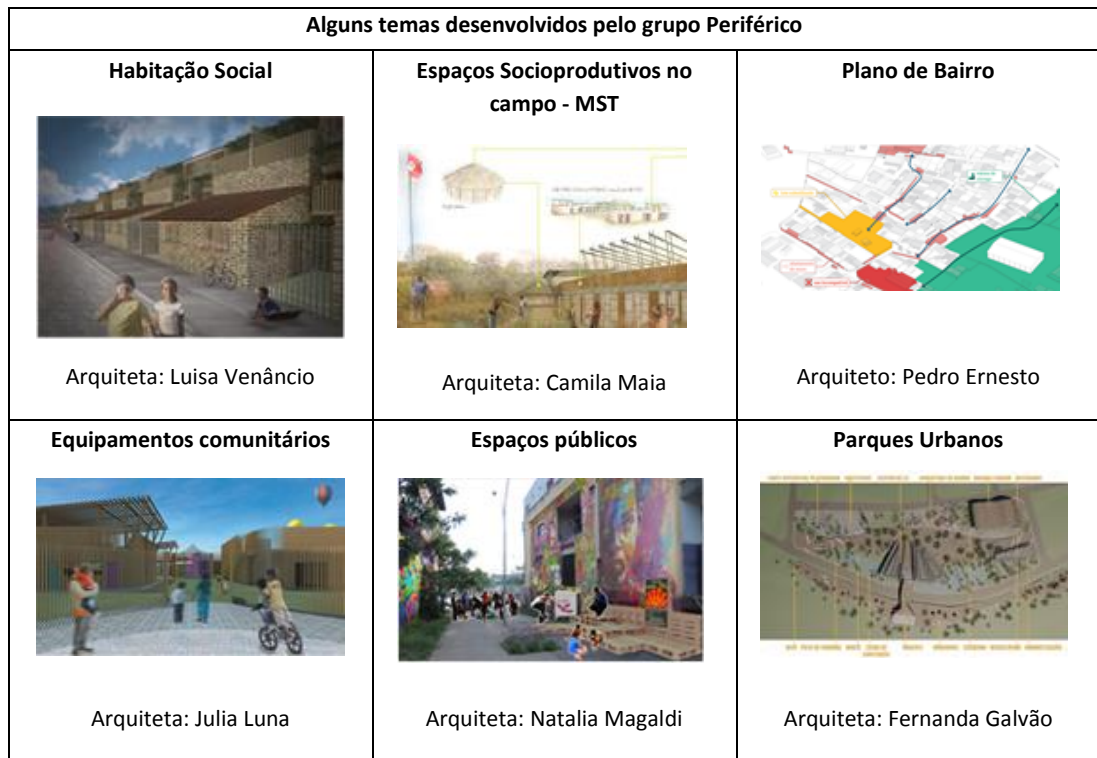
Tabela 1 – Alguns exemplos de projetos desenvolvidos pelo grupo Periférico

Até o momento foram desenvolvidos os seguintes temas no âmbito dos Trabalhos Finais de Graduação que envolvem o urbanismo participativo: habitação social, plano de bairro, espaços socioprodutivos no campo, centros comunitários, espaços públicos e parques urbanos, ilustrados na Tabela 1.