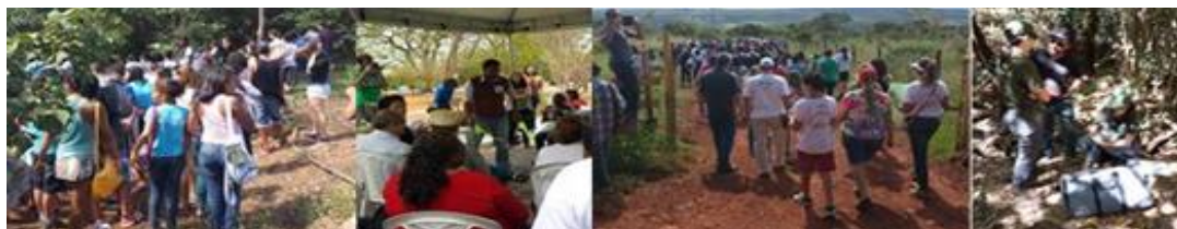
Figura 3 - Processo de projeto do Parque Sementes do Itapoã desenvolvido junto à comunidade do Itapuã – DF, desenvolvido por Priscila Mitti.