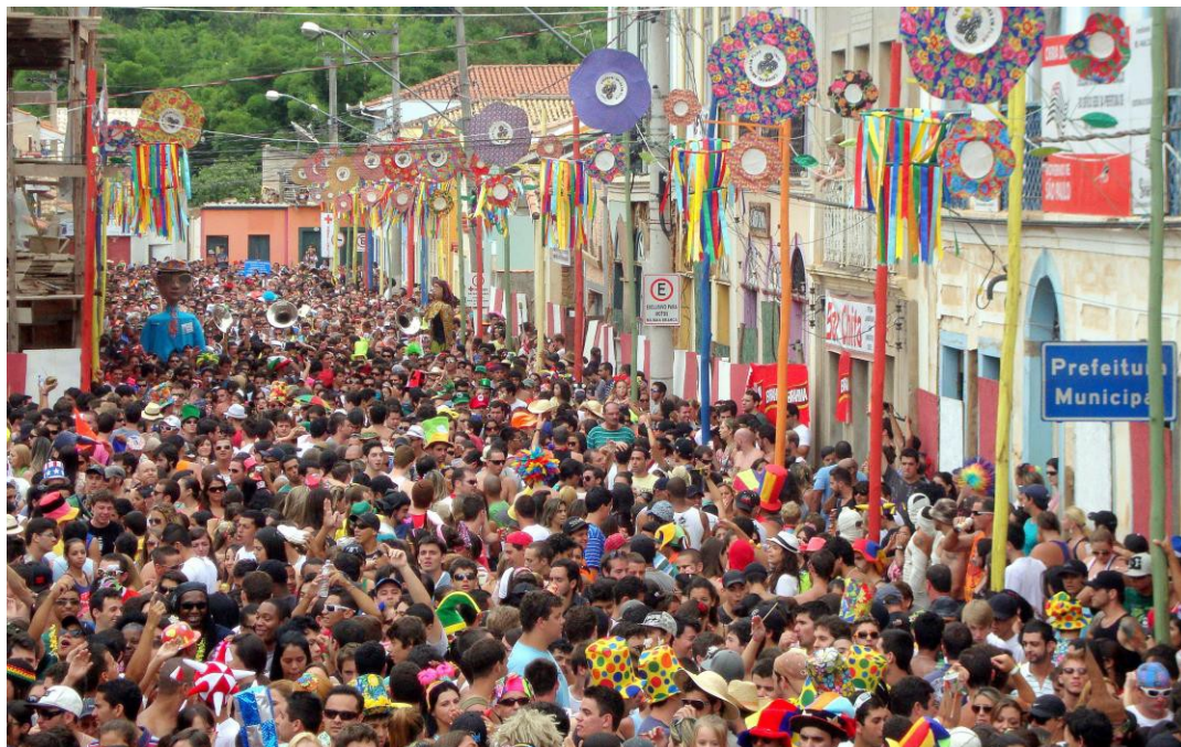
Carnaval no Centro Histórico de São Luiz do Paraitinga. 2012.

Porém, questões contemporâneas tais como “o desenvolvimento urbano, a mercantilização, as indústrias culturais e o turismo” (García Canclini, 1994, p.95), muitas vezes fazem São Luiz do Paraitinga viver uma situação limítrofe: a mercantilização de seu patrimônio cultural que, sem resistência, pode derivar em sua exploração indiscriminada; e, no caso do patrimônio arquitetônico, a conciliação entre as possíveis especulação imobiliária e degradação urbana com a tradição local.