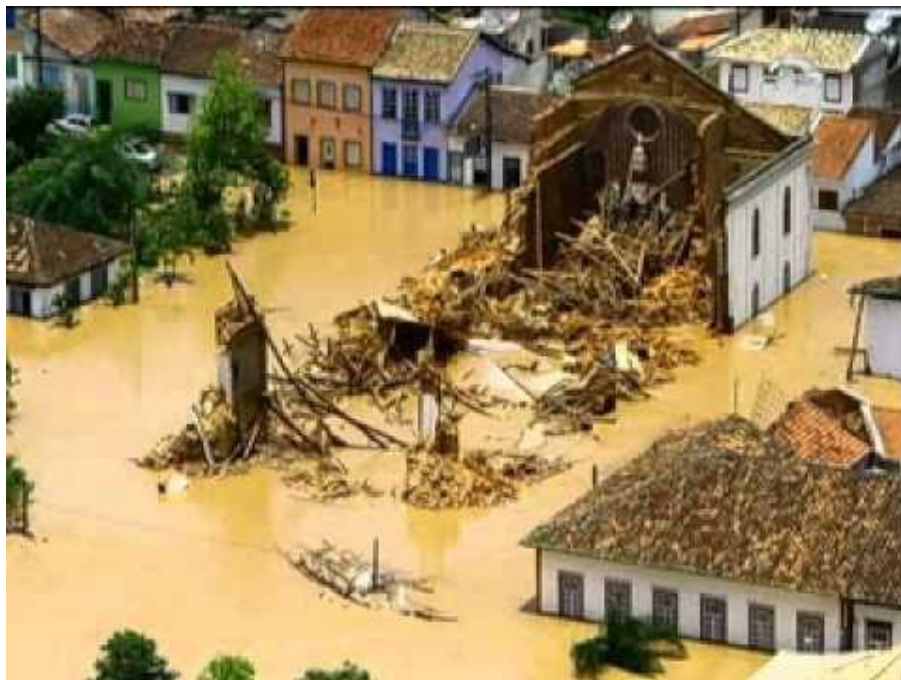
Centro histórico de São Luiz do Paraitinga na enchente. 2010.

Conjunto Habitacional Casinha Branca. Construção CDHU. São Luiz do Paraitinga. 2013.