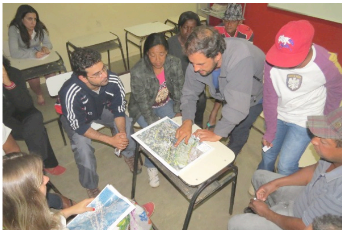
Figura 5 – Ciclo B das Oficinas Comunitárias, discussão em grupos.

O Ciclo B – Construção Coletiva foi o momento em que a comunidade teve voz e pode expor sua realidade, problemas, desafios e oportunidades, apontando todas as necessidades relacionadas à vida cotidiana e a chamada sociologia do presente em termos da chamada arte de resolver a vida (Ribeiro, 2013), trazendo problemáticas do cotidiano como tematizado em dimensões ou eixos propostos: social, ambiental, econômica e cultural.