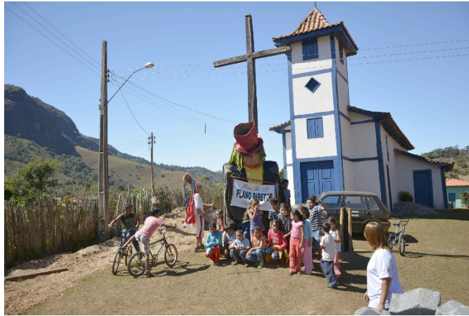
Figura 2 – Mobilização Social com alegoria no Distrito de Santo Antônio do Cruzeiro.

diretor e a importância dele na vida da população. Essa abordagem foi realizada tanto nos distritos e povoados, quanto nos bairros da sede urbana.