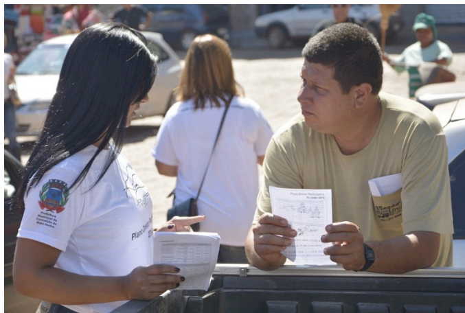
Figura 3 – Entrega de Panfletos e orientação sobre o Plano Diretor.