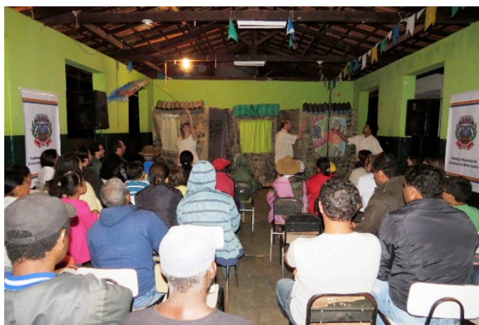
Figura 4 – Ciclo A das Oficinas Comunitárias, apresentação teatral.

O Ciclo A – Entendendo o Plano consistiu na apresentação do que é um Plano Diretor e como a sua revisão apontava para seu aprofundamento e aperfeiçoamento, buscando formas de sensibilização e educação para a participação continuada em processos de engajamento social perpetuado.