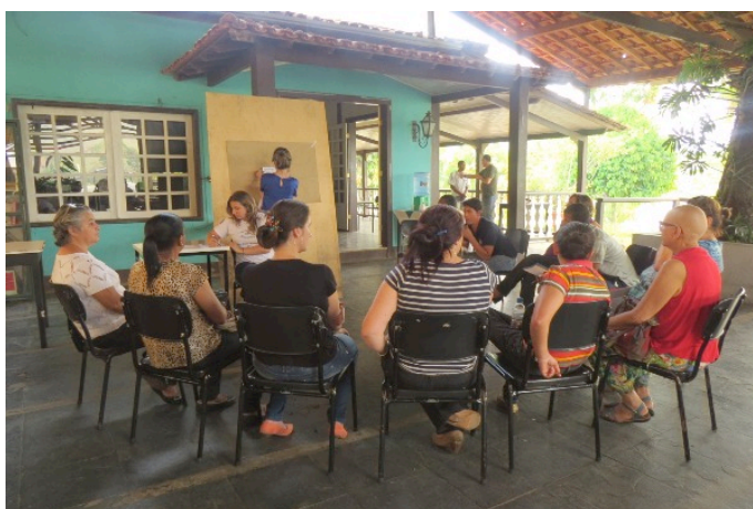
Figura 6 – Ciclo C das Oficinas Comunitárias, construção da árvore de problemas.

No Ciclo C – Resultados da Participação foram apresentados os resultados obtidos na construção coletiva, ou seja, os resultados do ciclo anterior, em consonância com a leitura técnica, bem como apresentadas as prioridades definidas pela comunidade de forma particular a cada lugar e também numa perspectiva socioterritorial comparada. Na sequência, a comunidade levantou as causas e efeitos dos principais problemas que enfrentam, para então elaborar diretrizes gerais acerca de como solucioná-los.