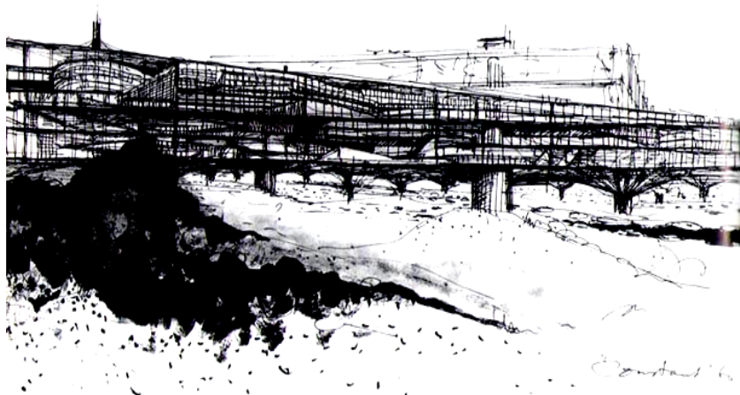
Figura 3 - Nova Babilônia: a cidade dos espaços livres. Vista da cidade, 1960

A idéia da casa, do grão, do elemento isolado, da cidade tradicional, perde foco para uma escala mais ampla, a escala do complexo arquitetônico. Para Constant é na grande escala que se encontra a liberdade arquitetônica e humana. A autonomia do homem ocorre pelo espaço transformado pelo sujeito, pela sociedade. Cidade-cobertura, cidade-ponte, a cidade de Constant é construída por recombinações físicas e espaciais. A essência da New Babylon é a idéia da ponte que abriga a todos, da grande morada, daquilo que hospeda, vontade de acolhimento (figura 3).