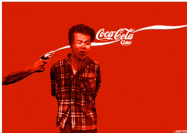
Figura 1 – The Coca Cola series

A visão do grupo sobre a formação da cidade tradicional moderna era baseada na sociedade do espetáculo e no urbanismo fragmento. Eles acreditavam que a espetacularização em geral, condicionava a sociedade a uma alienação e a passividade comum. Cidade espetáculo sempre sob constante vigia e controle, com caráter puramente disciplinar. Para o grupo a prisão torna-se modelo de habitação e nas cidades a rua um elemento puramente funcional, onde se atuariam nesses espaços vigilância e controle social (figura 1). A cidade tradicional moderna seria organizada a partir de um crescimento baseado no espetáculo, numa relação produção e consumo (Jacques, 2003, p.13).