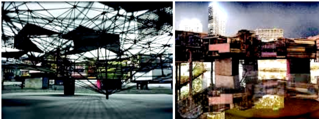
Figura 4 e 5 – A construção do vazio é a resposta morfológica urbana: criar através da experiência múltiplos lugares do lugar.

Num processo de construção infinita, de aceitar, incluir, sempre receber. A imagem da cidade New Babylon nunca será definitiva. Uma cidade que espera, recebe e hospeda tantos acolhidos definitivamente nunca terá um único rosto, uma imagem, um fim. Isso se traduz em estruturas físicas manipuláveis, recicláveis e de infinita mudança (figura 4 e 5). O rosto que hospeda a muitos, sempre será diferente, e o acolhimento se fará a todo instante sob o céu de suas estruturas.