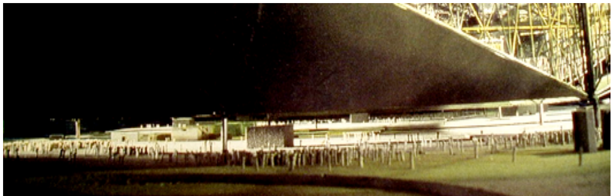
Figura 6 – Cobertura(ponte) sobre um setor da cidade de Constant, espaços para múltiplas atividades coletivas

Na efetiva revolução social, Constant não têm como objetivo gerar lugar, muito menos um projeto fim, mas ser essencialmente ético, onde as pessoas encontrariam o melhor modo de viver e conviver, através da criação de múltiplos lugares de um lugar, reinventando o cotidiano, transformando os hábitos, a vida. Uma grande e ilimitada casa, onde a superestrutura iria compor esse estrato superior de proteção dos indivíduos, acolhendo-os (figura 6 e 7).