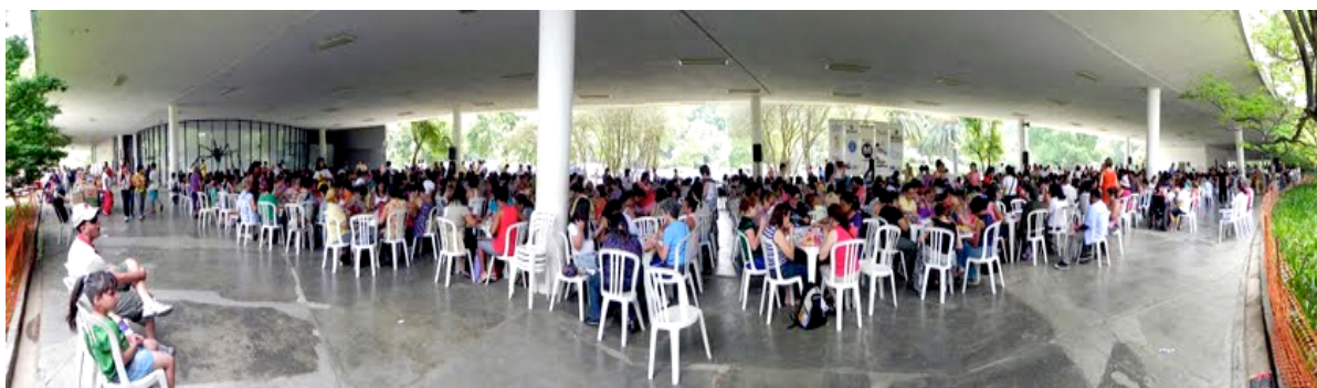
Figura 7 - Marquise do Parque Ibirapuera - Oficina de Artes de Cartões dez