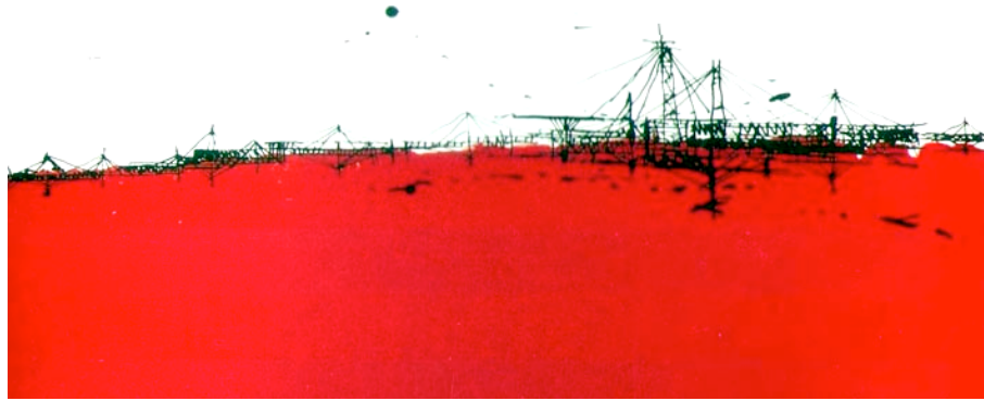
Figura 2 - Nova Babilônia, Litografia, 1963

plataformas flexíveis de extensões ilimitadas sem planejamento de ocupação dos espaços. Resgatando a possibilidade de gerar lugares ou setores com qualidades ambientais e comportamentais distintas e cambiáveis.