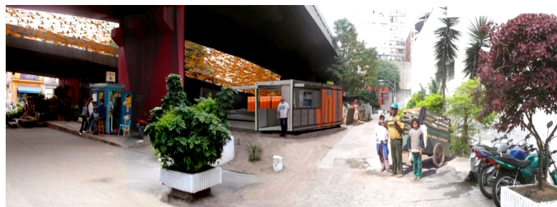
Figura 13 – Espaços infraestruturais: sob viadutos, espaço de transformação e novas situações de uso pela comunidade