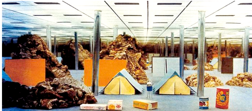
Figura 10 - Sob megaestruturas: imagem dos espaços como construção de sentidos e acontecimentos - Archizoom Associati - Non-stop City internal landscapes – 1970