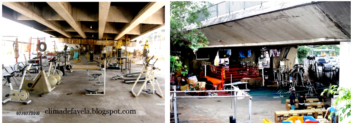
Figura 8 e 9 - Viaduto do Café SP: Academia, Boxe, Pré-escola e Biblioteca

Para Fuão (2012) acolher, é acolher a diferença, a todos, dando lugar ao lugar, abrir o lugar, dar passo ao outro. Portanto, nas cidades, os lugares de acolhimento são muitos, lugar de acolhimento é lugar de encontros, o espaço público, lugar aberto a todos. Lugar de acolhimento é produzido pela espera, pois não existe espaço enquanto o inesperado não chega, um lugar sem lugar enquanto o outro não ocupa o seu interior, a casa, aquilo que o cobre e o protege. Assim, hospitalidade como sinônimo de acolhimento coloca o tema do espaço não no espaço, nem na arquitetura, mas no indivíduo, na sociedade reproduzida na cidade de Constant (figura 8 e 9) (Fuão, 2012a).