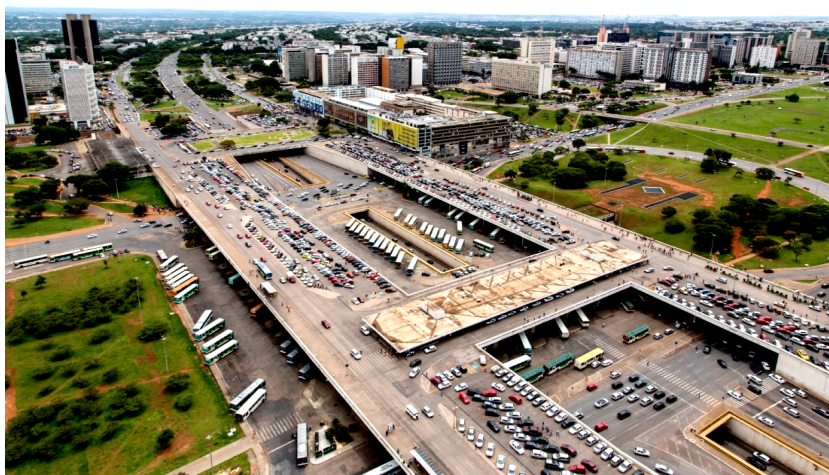
Figura 11 – Sistemas com possibilidades de vitalidade e acolhimento urbano: estruturas intermodais de mobilidade urbana. Rodoviária de Brasília

A definição de arquiteturas infraestruturais nesse ensaio volta-se para as obras de mobilidade urbana. Aqui entendidas como elementos físicos de promoção de passagens e deslocamentos, obras de infraestrutura com finalidade específica, que promovem ou permitem fluxos de diferentes naturezas. Definindo e organizando os espaços da cidade, representado por pontes, viadutos, passarelas, estações de metro, estações rodoviárias, estações intermodais, túneis, plataformas, etc, (Meyer, 2001, pag. 8).