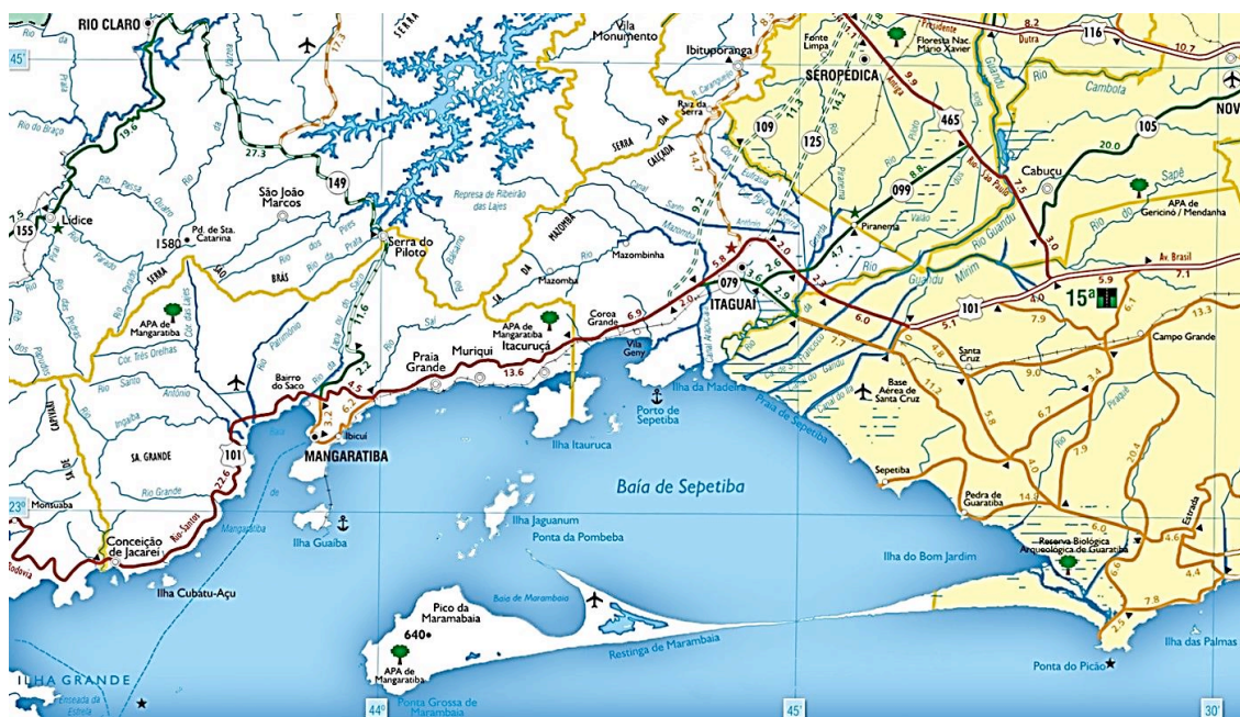
Figura 1: Imagem da Baía de Sepetiba

A Baía de Sepetiba é um estuário semiaberto com 447 km 2 de área localizada a cerca de 60 km a oeste da cidade do Rio de Janeiro. É composta por três sub-bacias 1 hidrográficas que envolvem 15 municípios do Estado do Rio de Janeiro, são eles: Itaguaí, Seropédica, Queimados, Engenheiro Paulo de Frontin, Japeri, Paracambi (totalmente abrangidos); Miguel Pereira, Mangaratiba, Vassouras, Barra do Piraí, Mendes, Nova Iguaçu, Piraí, Rio Claro e Rio de Janeiro (parcialmente abrangidos). Em relação à costa marítima, a Baía de Sepetiba banha três municípios fluminenses: o município do Rio de Janeiro (MRJ), nos bairros de Barra de Guaratiba, Pedra de Guaratiba, Sepetiba e Santa Cruz; o município de Itaguaí, sendo a localidade da Ilha da Madeira o sítio dos terminais portuários; e o município de Mangaratiba.