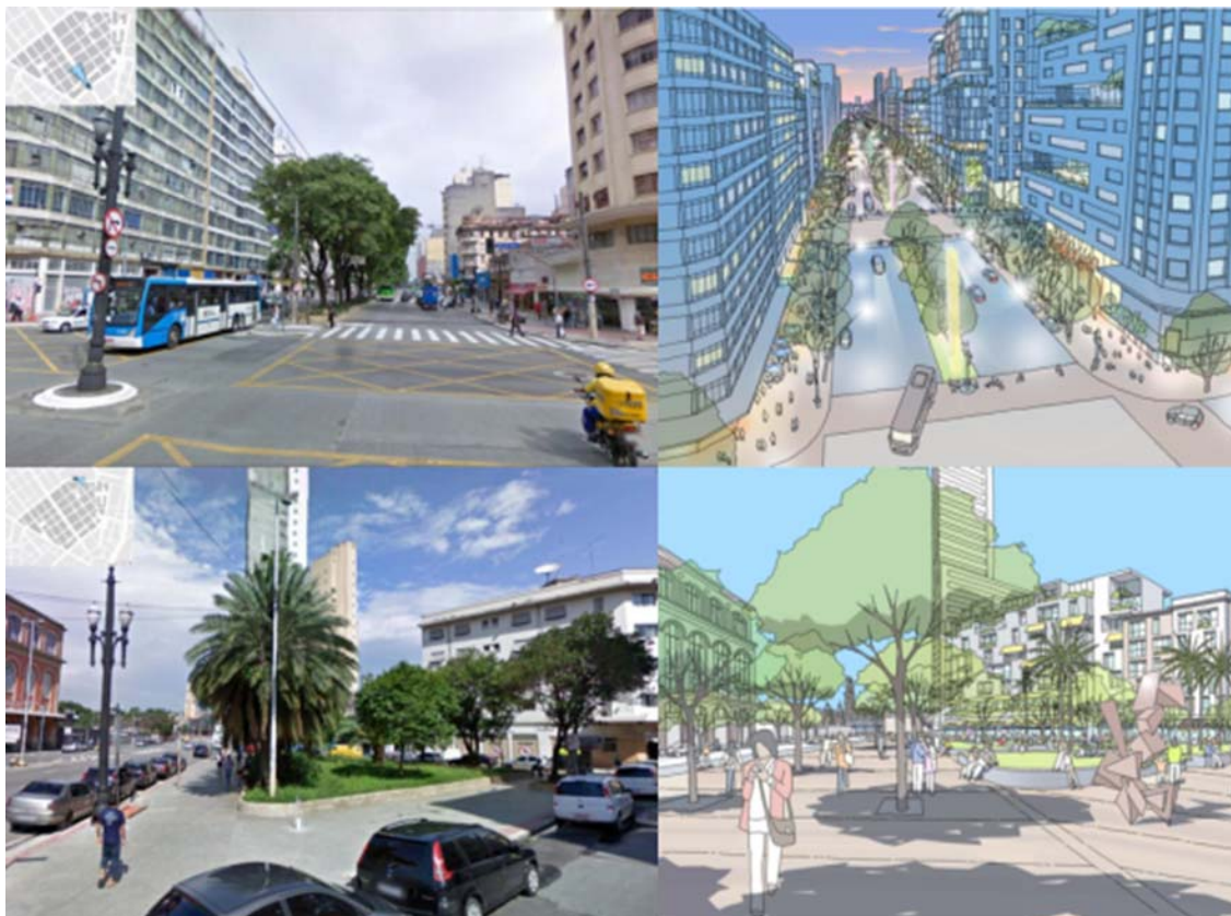
Figura 3: Nova Luz: ilustrações da transformação proposta

específicas da intervenção urbana integrantes do projeto urbanístico específico e do respectivo contrato de concessão urbanística” (Lei 14.918/2009. Art. 4º).