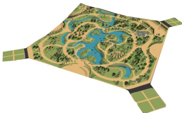
Figura 04: Parque Municipal em seu tamanho e projeto original em 1897.