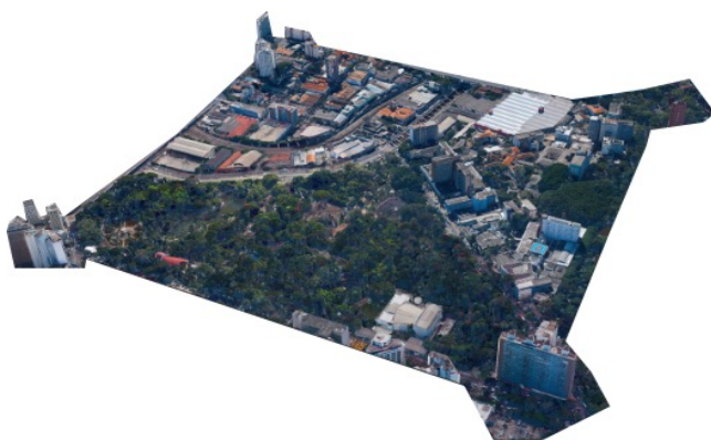
Figura 05: Parque Municipal na situação atual 2014.