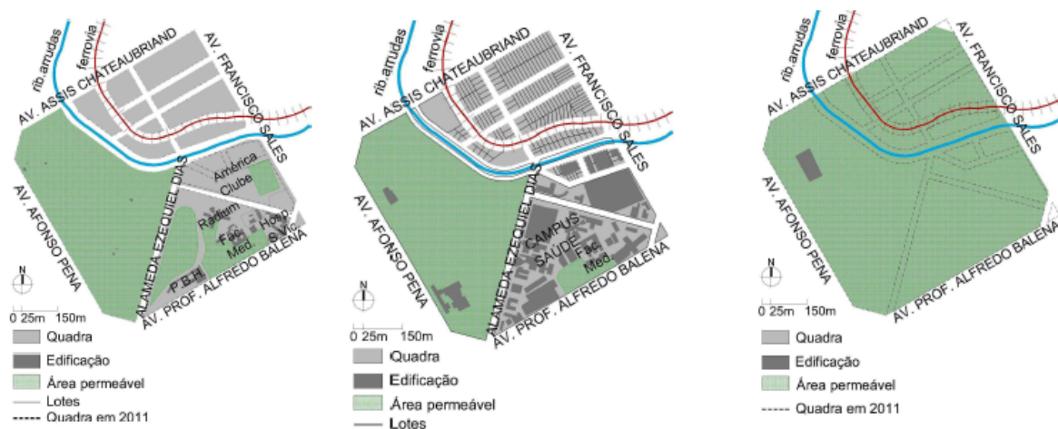
Figura 03: Área do Parque Municipal, em 1897, 1942, 2011.