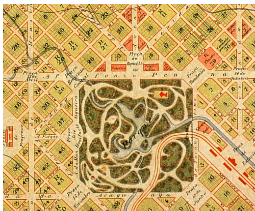
Figura 02: Implantação original do Parque Municipal, inserida na malha rígida da nova capital, com características dos jardins ingleses.

Foram propostas 6 (seis) praças em seu entorno, todas com acesso ao parque, marcadas por referências históricas e ícones relacionados à República. Quatro destas delas foram planejadas nos vértices do parque, cujo perímetro é quadrangular. As outras duas localizavam-se nos eixos laterais (figura 02).