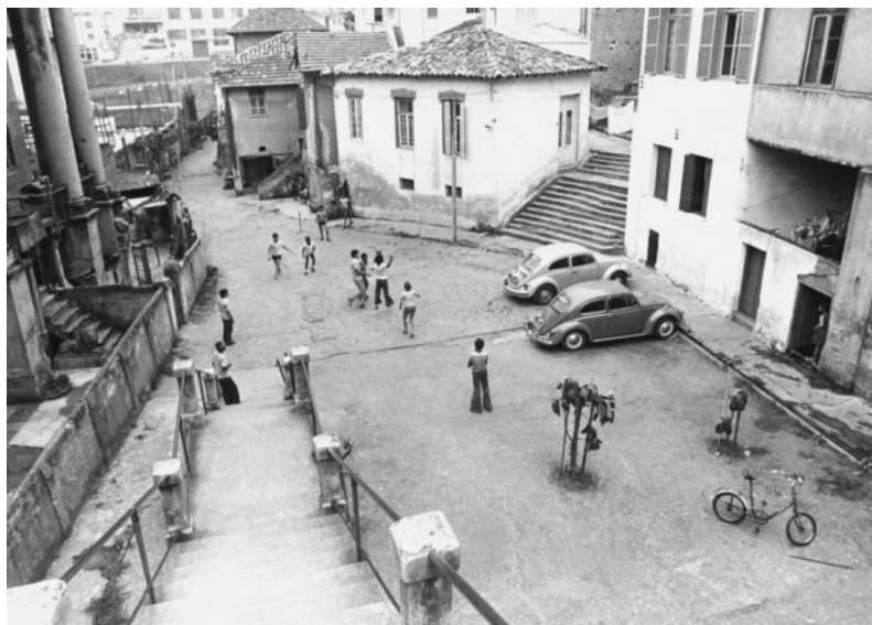
Fig 3. Aspecto da Vila Itororó no final dos anos 1970 (Acervo Estado)

uso do espaço livre da Vila pela vizinhança e por estudiosos que procuram o local para recreação ou pesquisa” (Tozzi, Toledo e Tozzi, 1976, p.70---71). 17