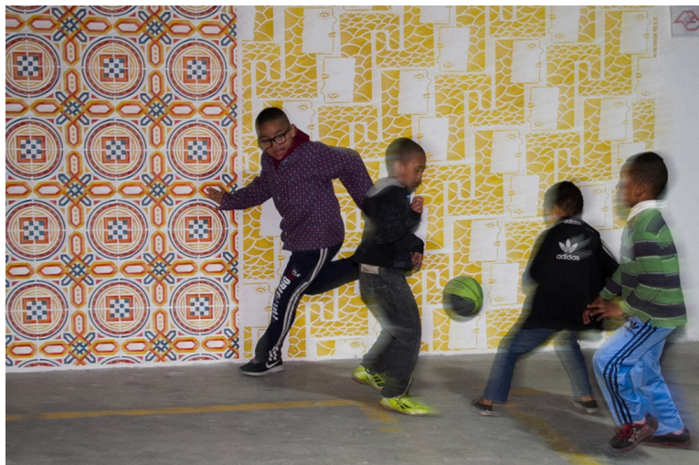
Fig. 4. Imagens das ações do Projeto Vila Itororó: Canteiro Aberto (2015): horta comunitária e jogo de futebol com painéis de Mônica Nador ( http://vilaitororo.org.br/como---habitar---a---vila/quintal/ )

Ao deslocar o entendimento do conceito de “cultura” das manifestações artísticas para a ideia de “cultura como modo de vida”, tomando um sentido mais próximo aos antropólogos, o projeto Canteiro Aberto propõe-se a reconstruir coletiva e democraticamente com aqueles que “usam” a Vila os sentidos possíveis desse novo espaço público na e para a cidade de São Paulo. 27 Partindo do pressuposto que a cultura não é privilégio de uma classe, nem algo separado da vida, ao se defender a cultura como algo presente todo o tempo na vida de todos talvez seja possível afinal refazer a Vila Itororó como uma parte da cidade – com suas memórias e sua história –, nos novos usos ou reinterpretação de usos que ela possa vir a ter no século XXI.