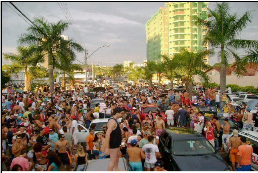
FIGURA 2: Avenida Cel. Cirilo de Moraes em Caldas Novas durante a realização do Caldas Country 2012

Na figura 2 é possível visualizar a situação das vias públicas de Caldas Novas durante a realização do Caldas Country em 2012.