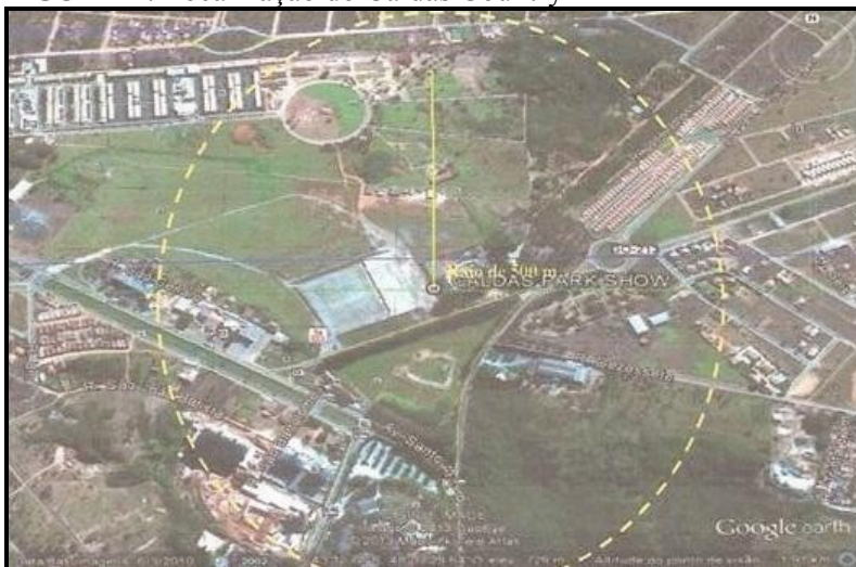
FIGURA 1: Localização do Caldas Country

A estrutura e localização do evento encontra-se na Gleba Remanescente 5, destacada da Fazenda Serrinha, denominado Chácara Roma, correspondendo a uma área de 152.910,26 m 2 (Figura 1). As coordenadas geográficas são 17°43' 32.72" S/ 48°37' 29.59" O. O terreno conta com uma altitude de 727m (EIV/CALDAS COUNTRY SHOW, 2013).