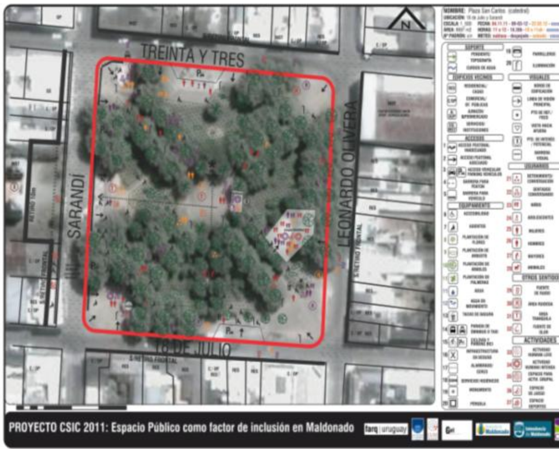
Ejemplo de Ficha y plano de relevamiento de Espacios públicos seleccionados.