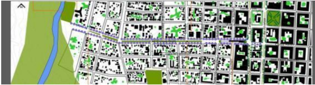
Detalle de la calle de la feria en San Carlos y su entorno

Allí, tras las consultas efectuadas, se optó por enfocar la posible remodelación del espacio de la Feria Vecinal Feria que funciona en la Av. Rodó de San Carlos, en tanto el potencial detectado en la misma para iniciar un proceso de reapropiación del patrimonio cultural, rural y urbano.