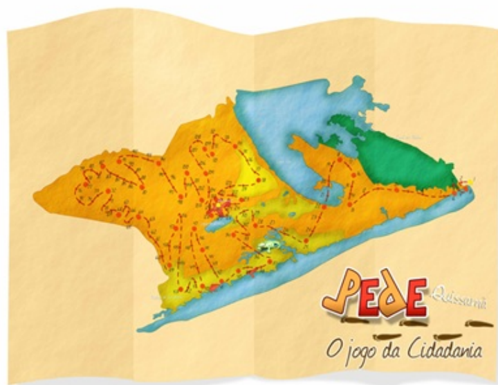
Fig. 4 - Tabuleiro do Jogo PEDE