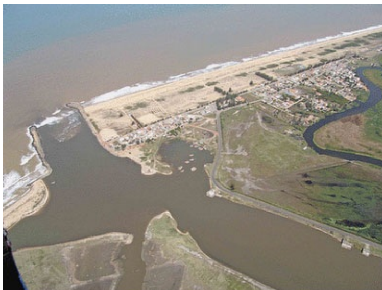
Figura 2 - Canal das Flechas em Barra do Furado

O setor secundário do município tem maior representatividade na indústria de alimentos, atingindo 98% do total da indústria de transformação, associada à cana-de-açúcar. No setor terciário, de pouca expressão na economia local, destacam-se a prestação de serviços; comércio varejista; transporte e comunicações. As atividades comerciais e de serviços são deprimidas pela influência prevaiente das estruturas de comércio e serviços das cidades de Macaé e Campos, centros populacionais cerca de 10 e 20 vezes maiores que Quissamã, respectivamente.