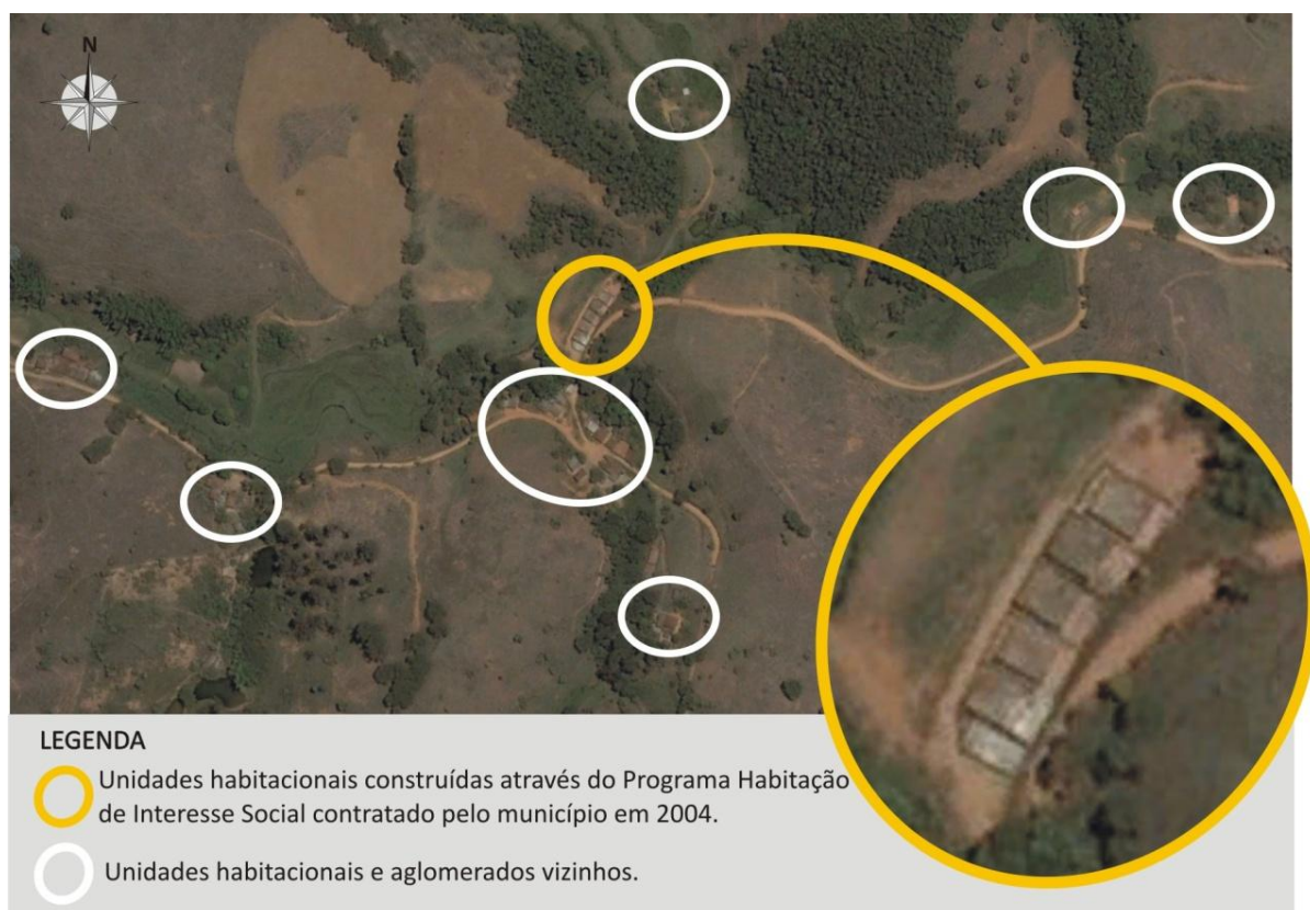
Figura 2. Rio Doce, MG. Localização das unidades habitacionais construídas na comunidade rural São José do Entremontes através do Programa Habitação de Interesse Social contratado pelo município em 2004.

contrapartida do município, conforme informações da Prefeitura Municipal. As unidades foram implantadas em uma gleba adquirida e parcelada pela administração municipal, uma vez que as famílias beneficiárias não dispunham de terreno próprio. Porém, além de as famílias beneficiárias já residirem em São José do Entremontes antes de serem atendidas pelo Programa, o que favorece a manutenção das relações sociais, tal gleba insere-se adequadamente na comunidade, sendo circundada por outras habitações e aglomerados, como pode ser observado na Figura 2.