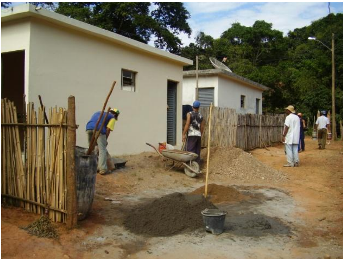
Figura 4. Rio Doce, MG. Unidades habitacionais construídas na comunidade rural de São José do Entremontes através do Programa Habitação de Interesse Social contratado em 2004.

padrão construtivo e de acabamento, apresentando uma estrutura que contempla fundação em sapatas corridas, pilares, cintas e lajes, como ilustra a Figura 4.