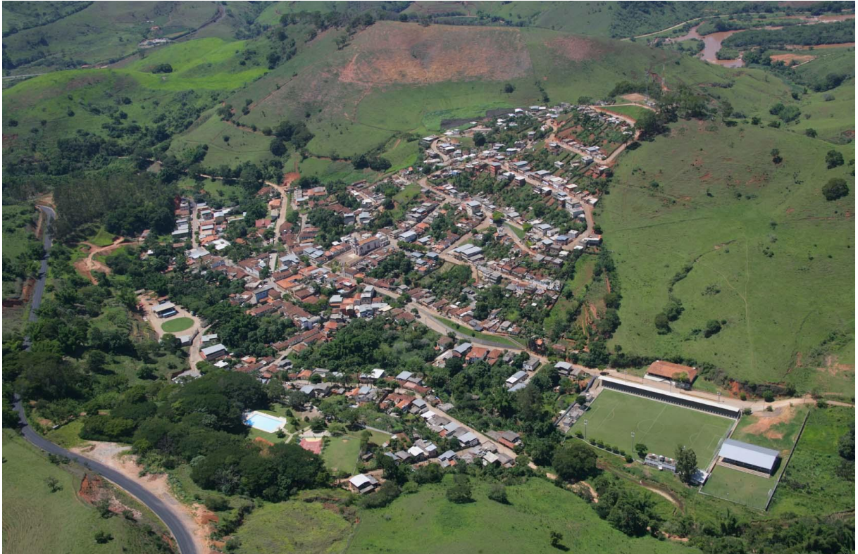
Figura 1. Rio Doce, MG. Vista aérea da área urbana do município. 2008.

Embora os municípios de pequeno porte não apresentem uma demanda expressiva por habitação, há um déficit qualitativo facilmente identificável, caracterizado por moradias sem condições de serem habitadas em função de sua precariedade ou de desgastes na sua estrutura física (Cf. BRASIL, 2009), e um déficit quantitativo decorrente, sobretudo, de moradias localizadas em áreas de risco, em áreas às margens de cursos d'água e de famílias em situação de coabitação. (CARMO e CARVALHO, 2010).