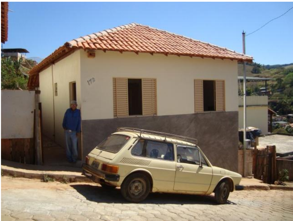
Figura 7. Rio Doce, MG. Unidade Habitacional construída através do Programa Habitação de Interesse Social contratado pelo município em 2006.

as unidades habitacionais apresentam cobertura com telhas cerâmicas, conforme ilustra a Figura 7.