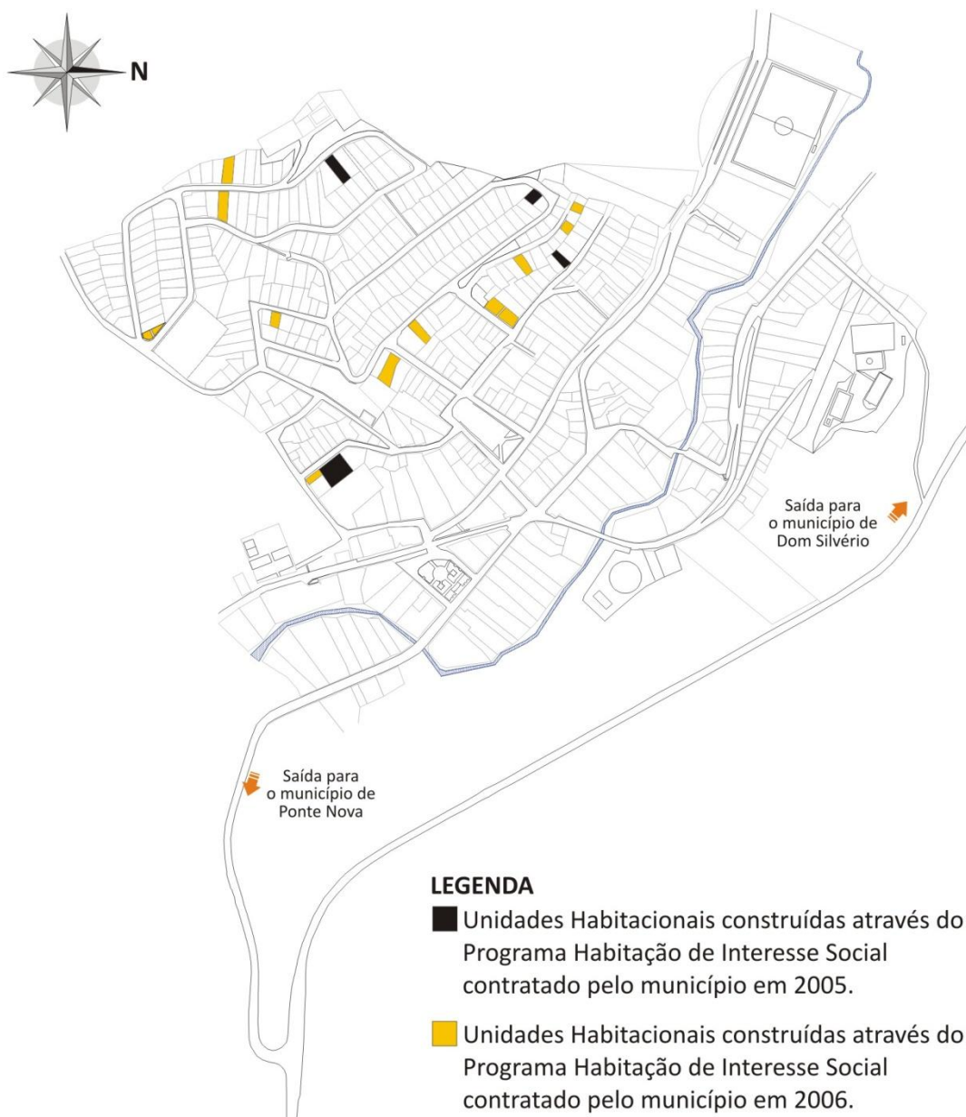
Figura 5. Rio Doce, MG. Localização das unidades habitacionais construídas na área urbana do município através da contratação do Programa Habitação de Interesse Social nos anos 2005 e 2006.