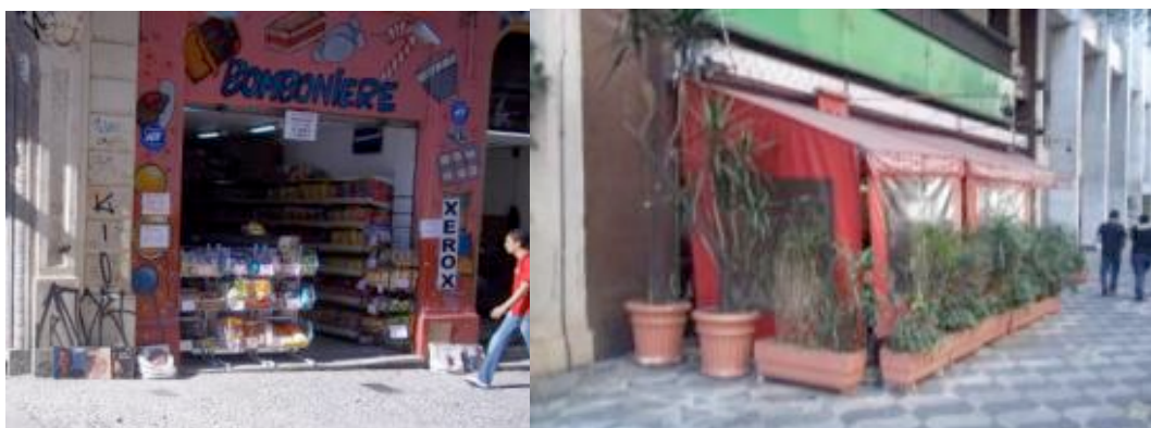
Figura 8 – “Para-formal” no formal na cidade de São Paulo.

Muitas das edificações comerciais são de interesse histórico e são de tipologia residencial (ecletico-historicistas), dificultando a existência e abertura de vitrines convencionais, assim, o comerciante opta pela exposição da mercadoria para fora de seu espaço privado, gerando o que chamamos de “para-formal” no formal.