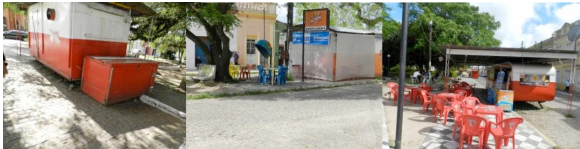
Figura 5 – Trailers na cidade de Jaguarão.

E. Análise do material coletado: Foram feitos alguns cruzamentos das informações obtidas a partir das cidades pesquisadas, descobrindo-se os tipos de atividades e equipamentos mais ou menos utilizados nas cidades e relacionando-o com o espaço urbano (figuras 5). Também descobriu-se como são os corpos “para-formais”, compreendendo quais as diferenças de um lugar para outro. Mas as principais análises focaram no espaço público onde as atividades “para-formais” encontravam-se, relacionando com a prática do urbanismo e do planejamento urbano.