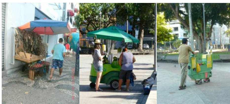
Figura 9 – Vendedores isolados móveis e ambulantes na cidade de Salvador.

Também são encontradas diversas formas de “para-formalidades” ambulantes, aquelas que caminham o tempo todo, se movimentam pela cidade: vendedores de produtos diversos, anunciantes, propagandas sonoras, divulgadores de produtos e estabelecimentos, etc.