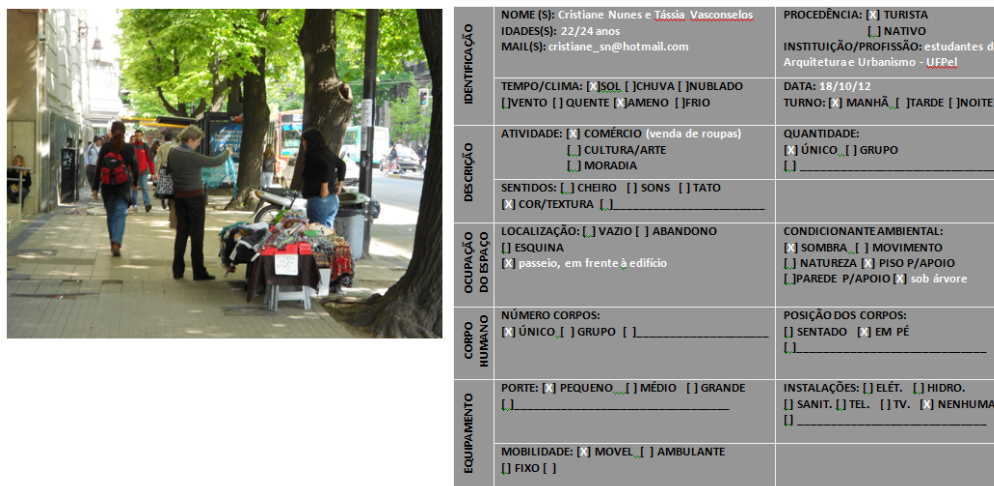
Figura 3 – Tabela de análise das cenas “para-formais”.

equipamentos “para-formais” presentes em cada cena registrada (bancas, cestos, caixas, bancos, etc.) (figura 3). Depois, após terem sido identificados (com base em atividades realizadas pós errâncias, com o grupo de participantes), foram analisados e classificados quanto ao seu tipo, porte, mobilidade e instalações, além de fazer a relação dos corpos com os equipamentos e de reconhecer elementos urbanos/ climáticos que possam modificar ou possibilitar as atividades (como o clima, a estação do ano, calçadas, marquises, etc.).