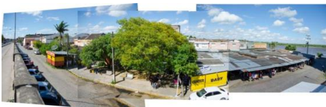
Figura 10 – Grande conjunto “para-formal” na cidade de Jaguarão.

• Grandes conjuntos “para-formais”: Conjunto este normalmente conhecido como “Camelôs” (figura 10), trata-se de um aglomerado de atividades “para-formais”, formado por bancas que vendem de vestuário a eletrônicos, passando por alimentos e de tudo o que se possa imaginar. É composto por trailers, bancas e alguns vendedores ambulantes. Na sua maioria as atividades ou equipamentos são fixos no espaço público. Sua implantação não segue nenhum padrão ou regularização definida, embora veladamente os espaços sejam definidos e demarcados. Circular por esses conjuntos é como andar em um labirinto.