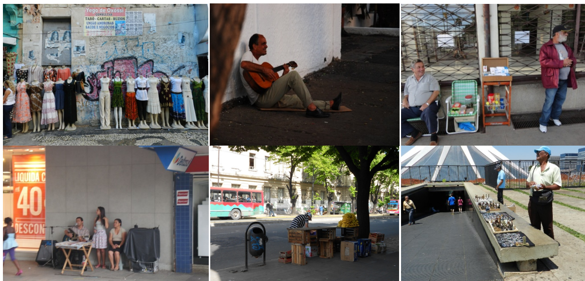
Figura 2 – "Para-formalidades". Fonte: Débora Allemand, 2013.

"Para-formal" é uma palavra criada pelo grupo argentino GPA (2010), 9 é um conceito de fronteira, que ao contrário da oposição entre o formal e o informal – a partir de áreas do conhecimento como o urbanismo e a economia, que categorizam seus estudos e objetos em cidade/economia formal e informal – busca experimentar a fresta ou o interstício entre categorias, que aqui denominamos como "cenas urbanas para-formais". Um modelo de investigação "para-formal" que se apropria de categorias alternativas para explorar o "campo do meio", a zona cinza, onde se desenvolve a verdadeira máquina da cidade. O "para-formal" nesse sentido, é algo artificial e provisório, algo relativo à forma, mas que ao mesmo tempo não se configura como tal, é um lugar do cruzamento entre o formal (formado) e o informal (em formação), entre o previsível e o imprevisível.