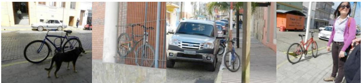
Figura 7 – Paraciclos inventados na cidade de Jaguarão.

- A bicicleta é um meio de expressão da sociedade e "grita" por espaço e por visibilidade. Nem mais, nem menos que os outros modais, ela deve apenas ser considerada no planejamento da cidade e nos projetos de ampliação ou reorganização viária.