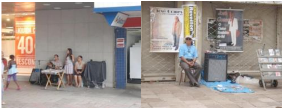
Figura 12 – Músicos urbanos na cidade de Pelotas.

O som é uma categoria que merece um estudo específico, pode ser harmonioso ou apresentar-se como poluição sonora no espaço da cidade. São compostos por toda a mistura que o espaço público suporta em suas cordas vocais, por isso às vezes desafina.