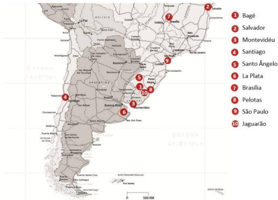
Figura 1 – Mapa de localização das cidades onde ocorreu coleta de dados do “para-formal”. Fonte: http://www.guiageo-americas.com/mapas/americasul-politico.htm . Edição: Rafaela Barros de Pinho, 2013.

leis da economia tradicional, do urbanismo e das relações humanas, que podem gerar mudanças importantes, tanto teóricas como práticas, na maneira de pensar e planejar a cidade.