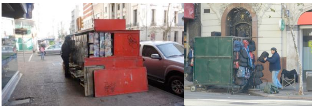
Figura 6 – Trailers na cidade de Montevideu.

O resultado da pesquisa apontou positivamente para o uso de trailers no espaço público, mostrando que as pessoas gostam de ter os equipamentos em sua cidade, pelos mais diferentes motivos: é tradicional, gera movimento e maior segurança à noite, gostam da variedade de lanches, atrai pessoas para o local, entre outros. Cabe ressaltar a péssima qualidade estética e sanitária de alguns desses trailers, o que para a imagem da cidade não causa uma boa sensação.