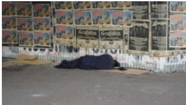
Figura 11 – Morador de rua na cidade de Montevidéu.

Tais moradores na maioria das vezes são pedintes, ou seja, vivem de pedir esmolas nas ruas, coisa que afeta o bem-estar da população que não se sente confortável com esta situação. Infelizmente é realidade em boa parte das cidades da América Latina.