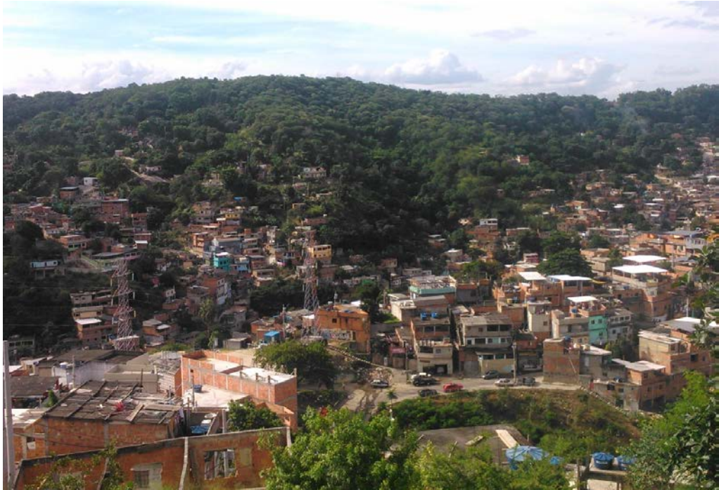
Imagem 4: Uma das estações do teleférico – ocupação consolidada.